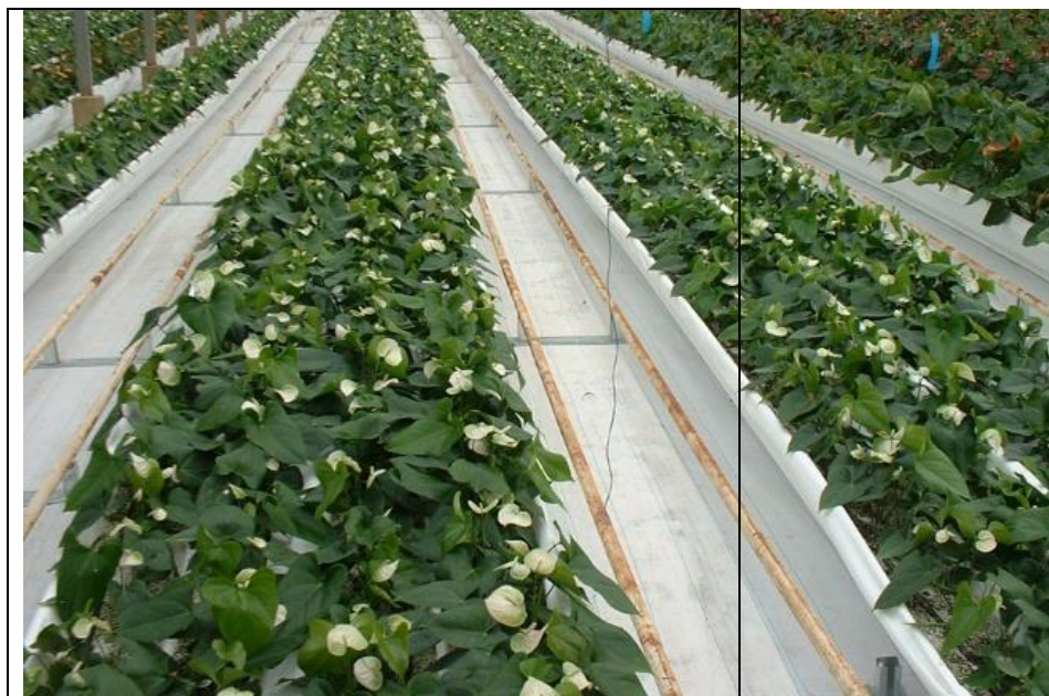
Anthurium in canaletta fuori suolo

Il presente disciplinare si applica alle colture floricole con categoria Fiore, fronda e foglia recisi in serra fuori suolo ottenute in conformità al Regime di Qualità (RQR) “Prodotti di Qualità” riconosciuto dalla regione Puglia ai sensi del reg. CE 1305/13 e identificato dal marchio Prodotti di Qualità (di seguito PdQ) registrato presso l'UAMI ai sensi del reg. CE 207/09 il 15/11/2012 al n. 010953875.